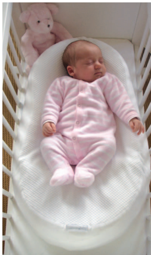
Желательно, чтобы Cosoonababy® прилегал головной частью к стенке детской кровати

Благодаря своей форме и наполнителю Cosoonababy® можно использовать как днем, так и ночью (ночью для более безмятежного сна, а днем для нормального бодрствования и развития) в течение первых месяцев жизни до тех пор, пока ребенок не начнет пытаться менять позу – признак того, что ребенок начинает приобретать автономию и пришло время покинуть кокон (примерно 3-4 месяца).