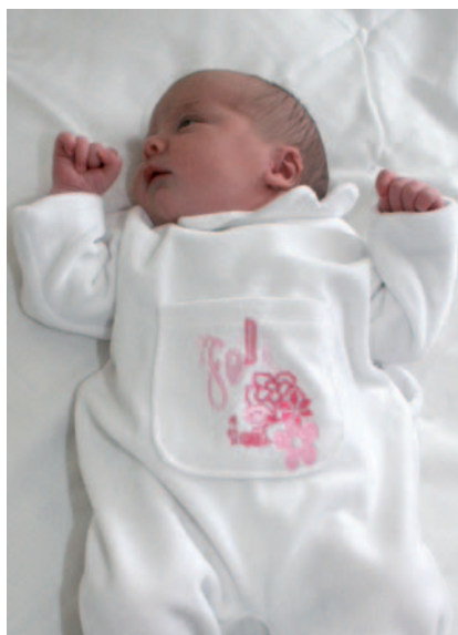
и на плоской поверхности